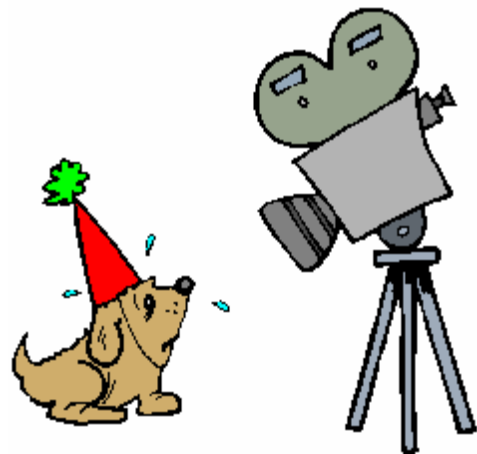
un film dramatique