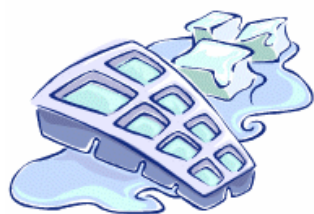
Il y a des glaçons dans le frigo.