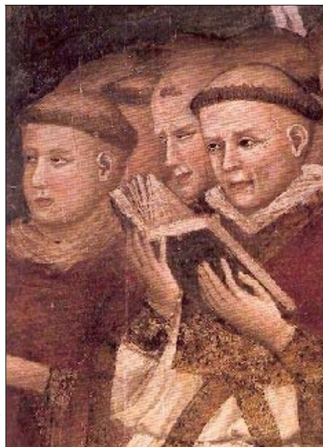
Chœur de moines

Sous l'autorité du pape Grégoire le Grand durant le Vème siècle, s'établissent une pratique religieuse unique mais aussi un style de musique. Le latin est imposé à toute l'église chrétienne. Les offices religieux sont codifiés (prières, chants...). Le chant liturgique ainsi unifié sera appelé plus tard "chant grégorien". Il s'imposera à pratiquement toute l'Europe chrétienne. Le chant grégorien est un chant pour voix d'hommes à l'unisson. Il a pour but de mettre en valeur les textes sacrés. L'endroit où il était chanté dans l'église s'appelle aujourd'hui le "choeur".