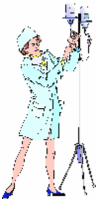
Une infirmière – un infirmier

Les noms communs qui se terminent par « er » changent en « ère » Attention : ne pas oublier l'accent grave.