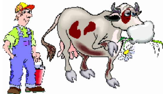
Le fermier – la fermière