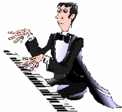
Le pianiste – la pianiste