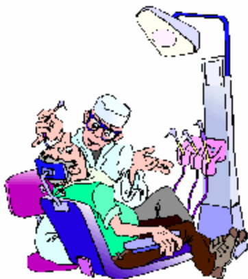
Un dentiste – une dentiste

Pour écrire un nom masculin au féminin, tu dois ajouter la lettre « e ». Certains noms communs ne changent pas ni au masculin ni au féminin, seul le déterminant change.