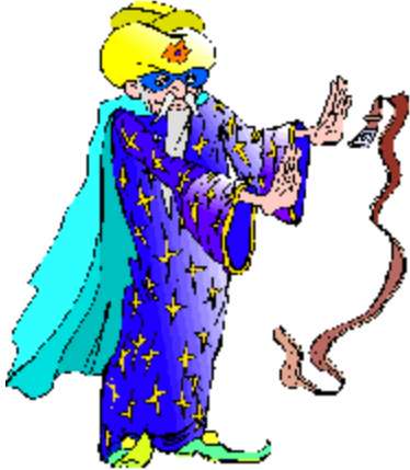
Le magicien – la magicienne

Les noms communs qui se terminent par »ien » changent en « ienne ». Attention : ne pas oublier les deux « n ».